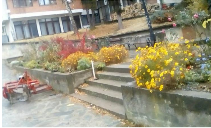
Зелена површина ул.Партизанска

Според извршените мерења на површините , бројот на садници и бројот на операции во текот на годината за реализација на програмата за оваа зелена површина се потребни финансиски средства од 37.746 ден .