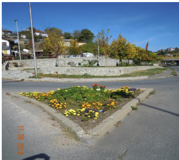
Зелена површина косина ул. Ратко Минев