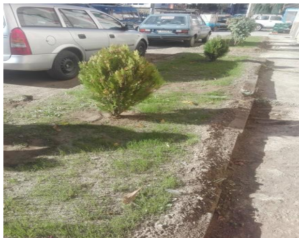
Зелена површина Осичка Мала(гаражи)

Според извршените мерења на површините , бројот на садници и бројот на операции во текот на годината за реализација на програмата за оваа зелена површина се потребни финансиски средства од 3.832 ден .