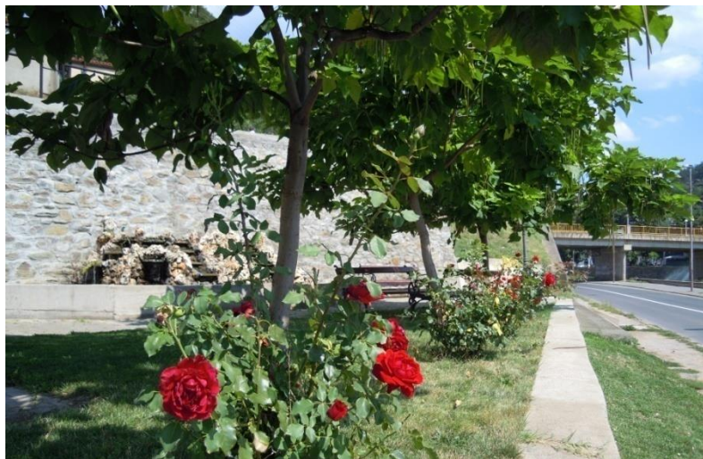
Зелена површина позади згради ул. Херој Карпош

Според извршените мерења на површините , бројот на садници и бројот на операции во текот на годината за реализација на програмата за оваа зелена површина се потребни финансиски средства од 130.202 ден .