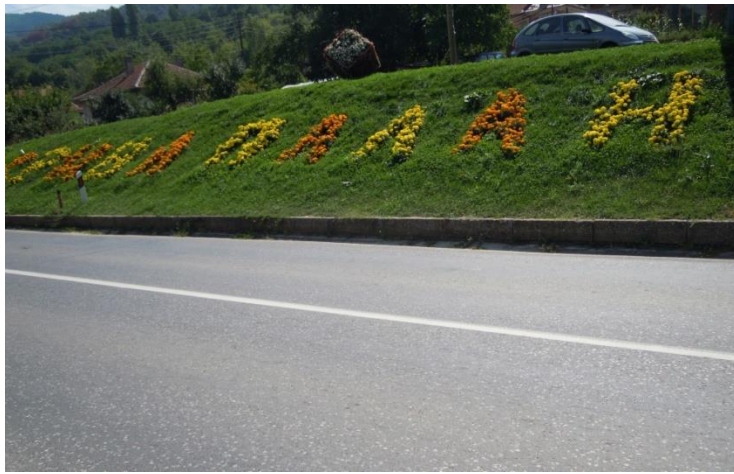
Зелена површина Раскрсници на влез и излез на градот