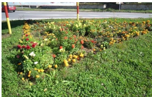
Зелена површина пред Касарна

Според извршените мерења на површините , бројот на садници и бројот на операции во текот на годината за реализација на програмата за оваа зелена површина се потребни финансиски средства од 125.907 ден .